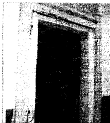
L'ascensore a Palazzo Zani

Castorina: «Servono wireless e ascensori»