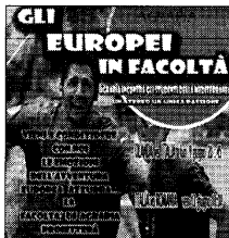
La locandina dell'iniziativa

LE imprese di Luca Toni e compagni alla facoltà di Agraria si vedono meglio. In occasione degli Europei di calcio in Austria e Svizzera, è possibile assistere alla diretta degli incontri degli azzurri sui maxischermi della facoltà più piccola della Mediterranea.