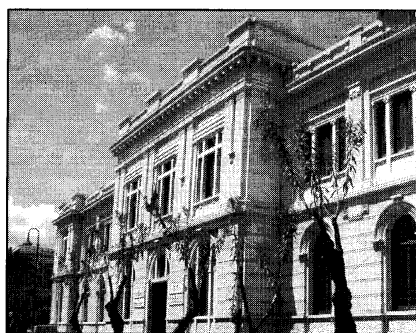
Palazzo Zani, sede della facoltà di Giurisprudenza

È dal momento che né negli altri atenei calabresi né a Messina è attivato il biennio, si tratterebbe di un trasferimento a dir poco "pesante". Sono trascorsi tre anni accademici dall'attivazione del Corso di laurea triennale in Scienze economiche (classe 28), che oltretutto quest'anno ha registrato 315 immatricolazioni che, sommate ai trasferimenti, fanno 365 studenti al primo anno. Ma gli appelli di studenti e rappresentanti puntualmente cadono nel vuoto. I disagi aumentano, le proteste pure. "È vergognoso che chi in-